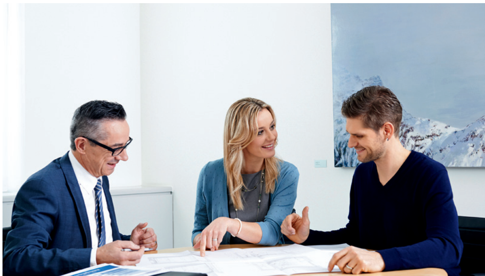
Ein kompetenter und verlässlicher Partner hilft, aus Visionen Realität werden zu lassen ( gkb.ch/hypotheiken ).